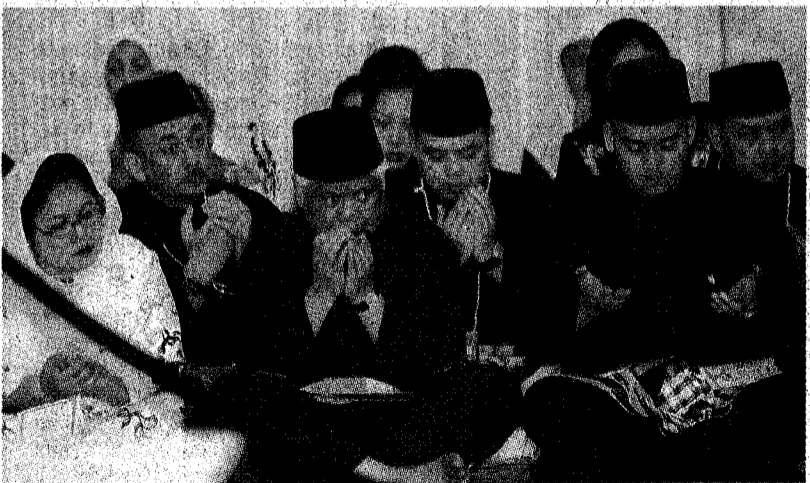
SEMOGA DIMAKBULKAN: Ahli keluarga Allahyarham Tun Ghafar mengaminkan doa tahليل di Makam Pahlawan Masjid Negara, semalam.

Penulis adalah bekas Ketua Pengarang Kumpulan yang kini Timbalan Pengerusi NSTP