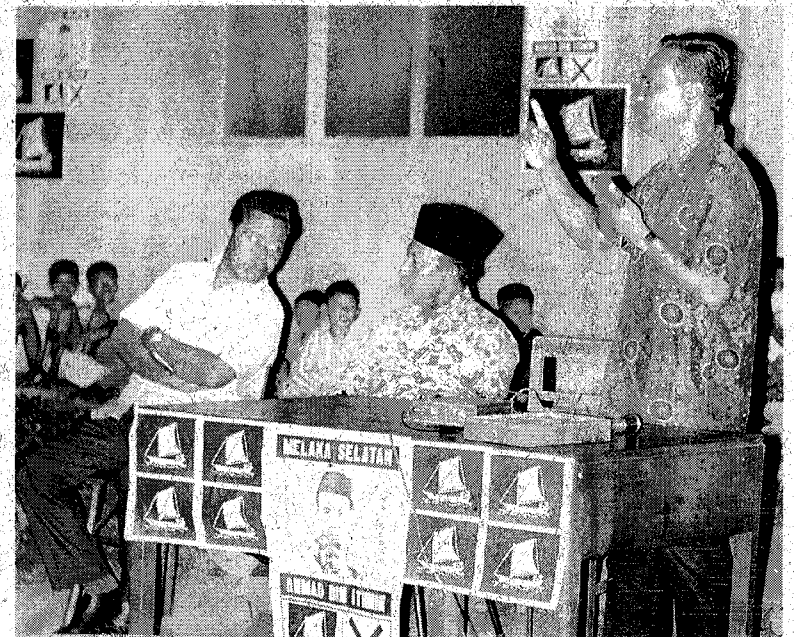
PENUH DEDIKASI: Tun Ghafar berucap pada kempen pada Pilihan Raya Umum 1971.