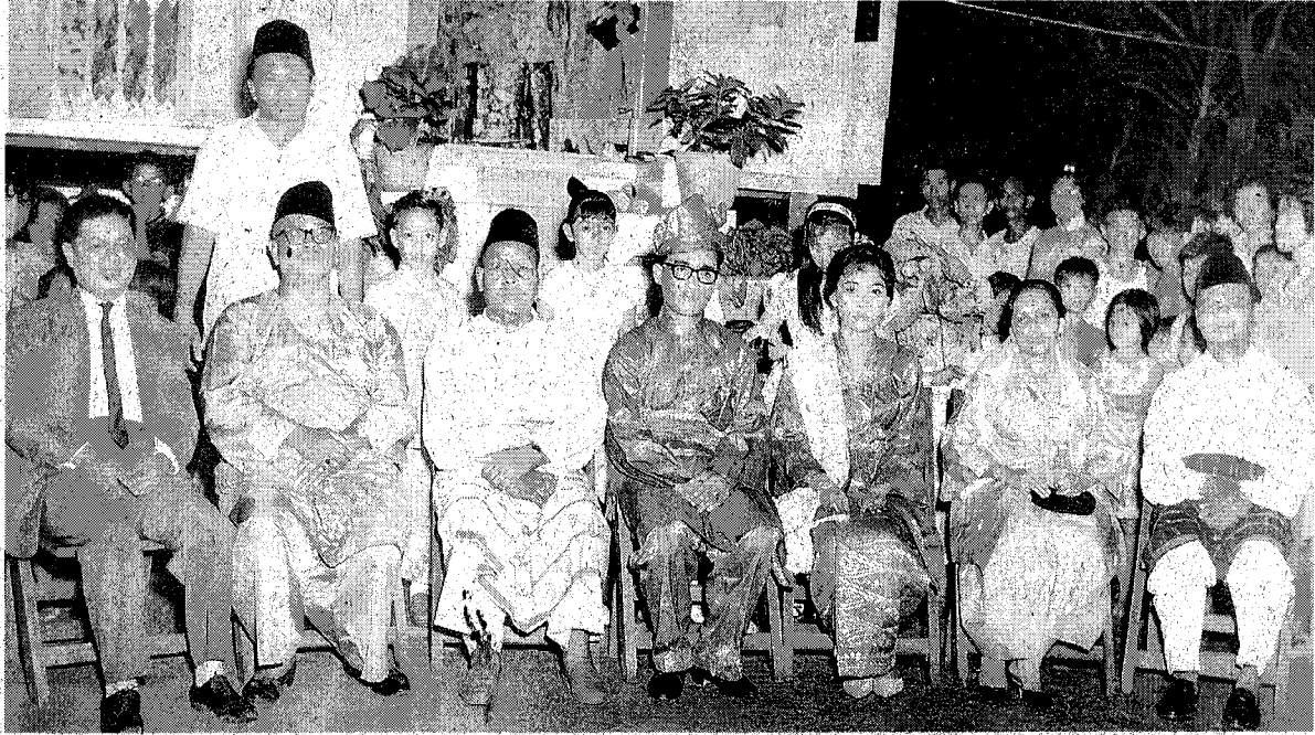
JADI KENANG: Tun Ghafar menghadiri satu majlis perkahwinan yang berlangsung di Melaka.