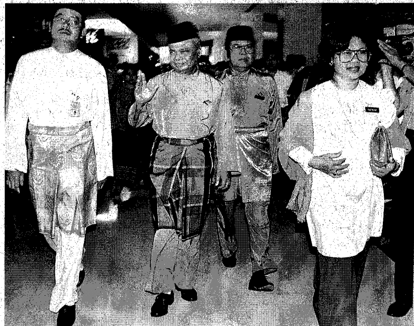
PENUHI TANGGUNGJAWAB: Tun Ghafar ketika menghadiri persidangan Pergerakan Pemuda dan Wanita Umno pada 1989.