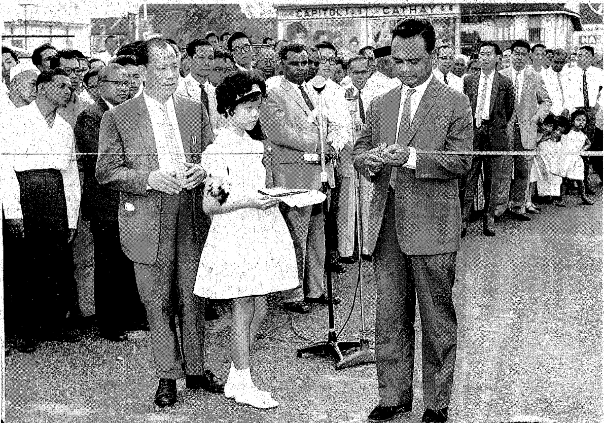
TANDA PERASMIAN: Tun Ghafar memotong riben tanda pembukaan lebuh raya moden di Melaka pada 1963.