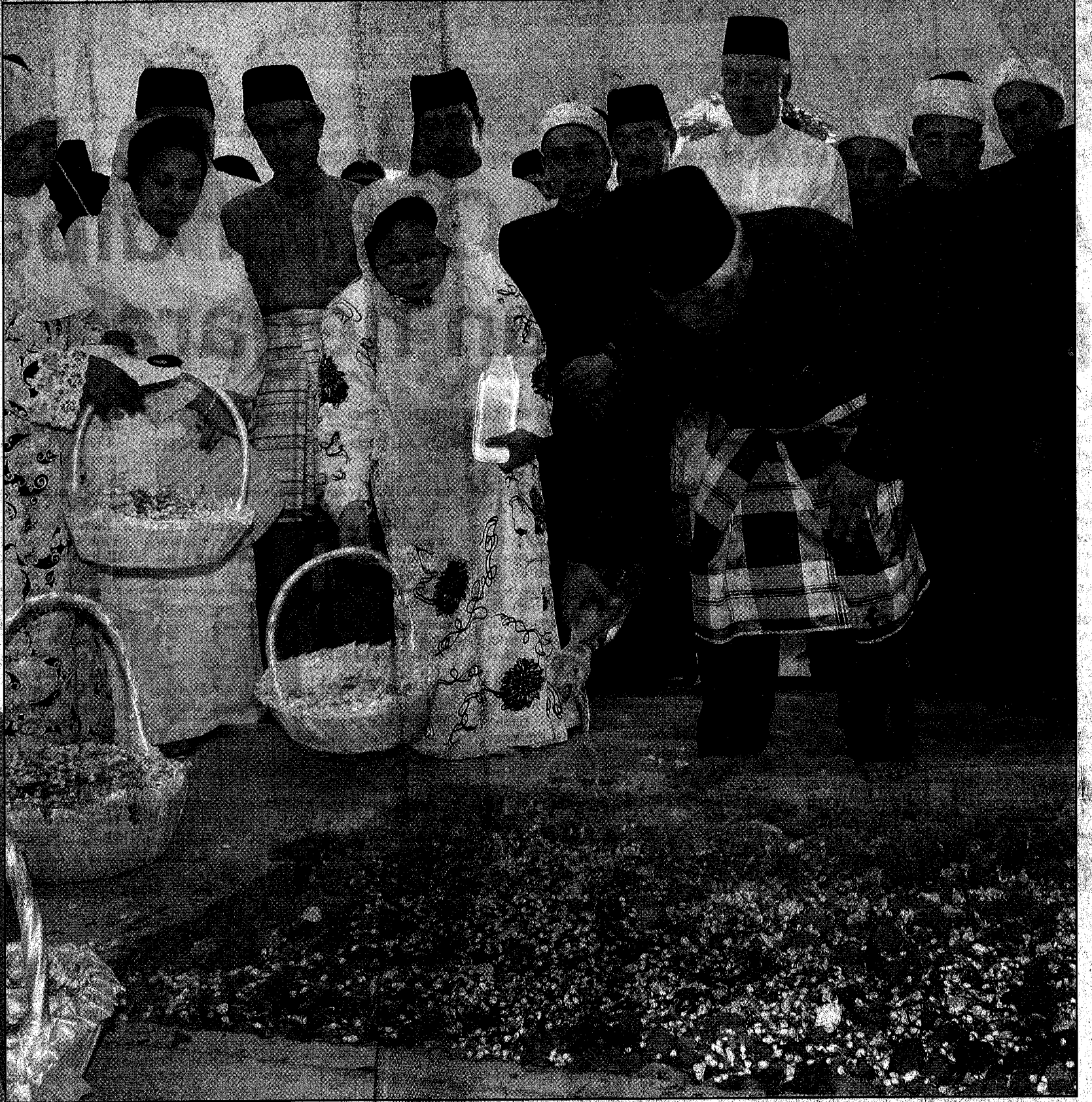
ALLAHYARHAM TUN GHAFAR BABA