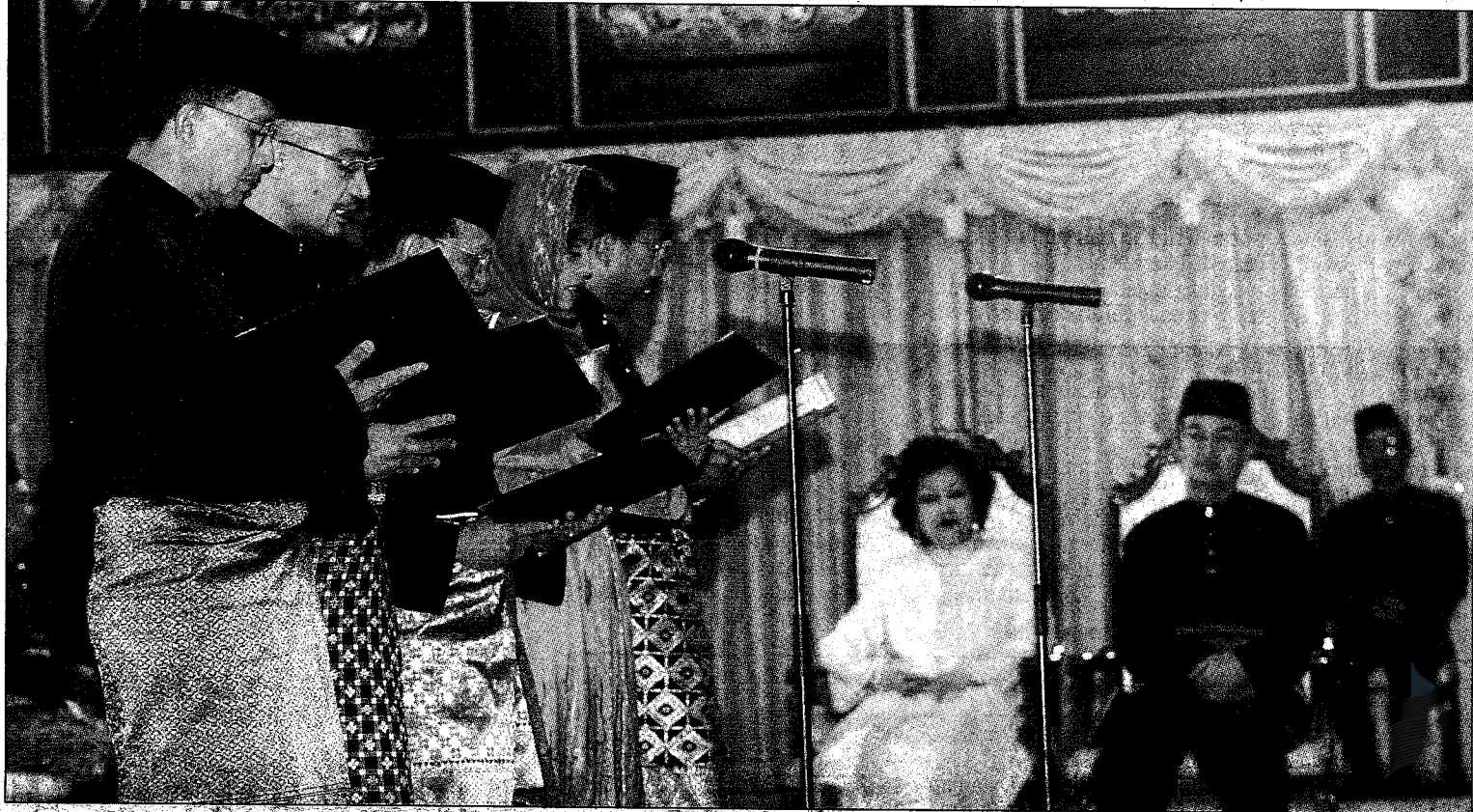
LIMA menteri (dari kiri) Azmi, Hishammuddin, Rais, Shahrizat dan Jamaludin mengangkat sumpah jawatan, taat setia dan menyimpan rahsia di hadapan Yang di-Pertuan Agong di Balairong Seri, Istana Negara. Turut hadir, Perdana Menteri dan isteri.