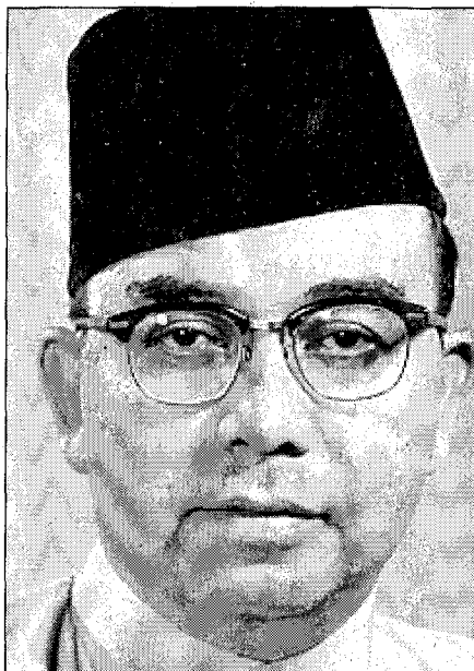
Allahyarham Tun Abdul Razak

Allahyarham Tun Abdul Razak Hussein yang bertanggungjawab mewujudkan Dasar Ekonomi Baru (DEB) pada 1970 menyimpan niat suci dan murni untuk melihat orang Melayu tidak terpinggir di negara sendiri.