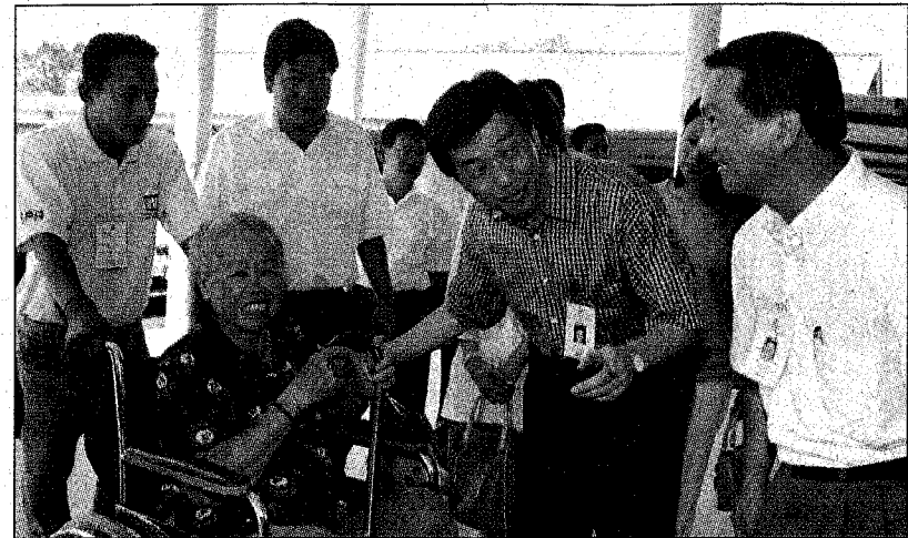
ONG KA TING beramah mesra dengan pengundi di Pekan Nenas, Johor.

Menteri Pembangunan Wanita dan Keluarga, Datuk Seri Shahrizat Abdul Jalil pula mengundi di Sekolah Menengah Kebangsaan (SMK) Bangsar,