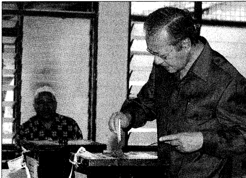
DR MAHATHIR mengundi di Sekolah Kebangsaan Titi Gajah, Alor Star, semalam.

Di SARAWAK , Menteri Tenaga, Telekomunikasi dan Multimedia, yang juga pengasas Parti Bansa Dayak Sarawak (PBDS), Datuk Amar Leo Moggie