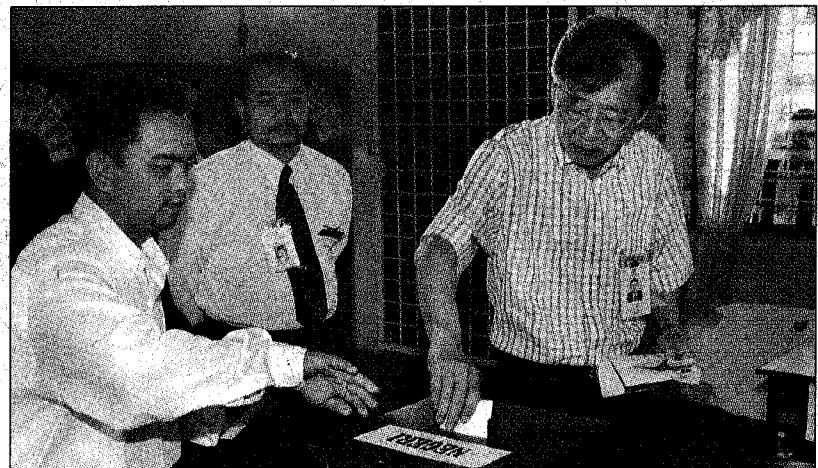
DR LIM mengundi di Sekolah Methodist Ayer Tawar, semalam.