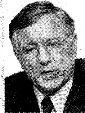
HANS VON SPONECK