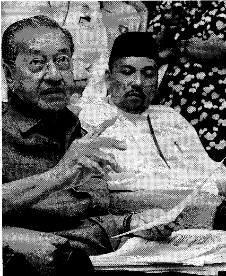
TERUS MENKRITIK: Dr Mahathir diberikan tempoh dua bulan lagi pun, tiada siapa boleh meyakini kemelut ini akan berakhir.

Lebih daripada itu, beliau turut mengeksploitasi sepenuhnya kesoganan sebilangan anggota Kabinet dan Ahli Majlis Tertinggi Umno untuk menjawab hujah-hujahnya atas rasa hormat terhadap seorang bekas pemimpin yang