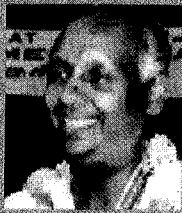
Nama: Tun V. T. Sambanthan Tahun Berkhidmat: 1955 - 1973