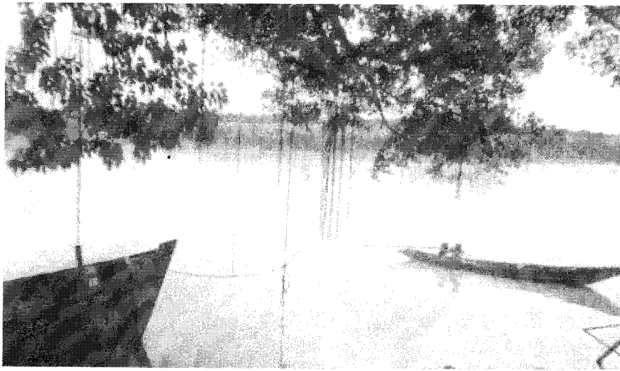
Alam sekitar yang indah, damai menyenangkan rasa

sekerja dan pertubuhan majikan. Penyebaran maklumat dan latihan akan diperkembangkan merangkumi pembuat keputusan di antara pekerja dan majikan. Program latihan tenaga manusia akan direkabentuk untuk membolehkan pelatih menangani masalah alam sekitar dan pembangunan.