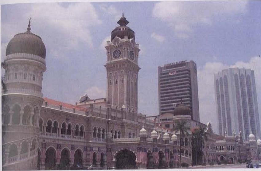
AMAN: Kemakmuran hari ini adalah hasil pengorbanan generasi terdahulu.

“Oleh itu lebih banyak usaha harus diambil untuk menerang dan menjadikan mereka lebih peka serta menghargai erti sebenar hari kebangsaan,” ujarnya sambil menekankan nilai kesiap-siagaan untuk berkorban wajar menjadi kunci perjuangan generasi muda hari ini.