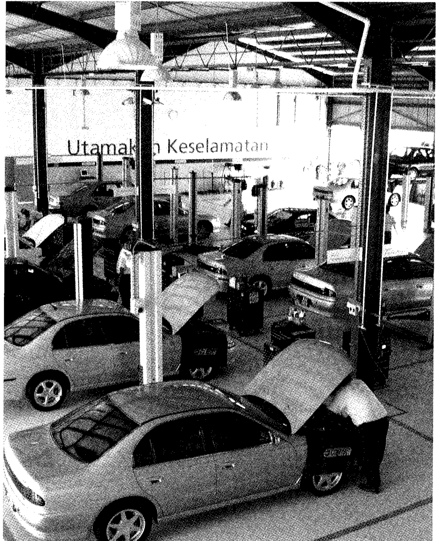
CANGGIH... Penyenggaraan berjadual dan cegahan yang disediakan oleh pengurus fleet SPANCO memastikan tahap penggunaan kenderaan yang optimum untuk pelanggan.

Pelbagai faedah bakal diperolehi apabila syarikat menyedari betapa pentingnya pengurusan fleet dalam survival korporat mereka. Di sinilah SPANCO sebagai pengurus fleet profesional mempamerkan kelebihanannya.