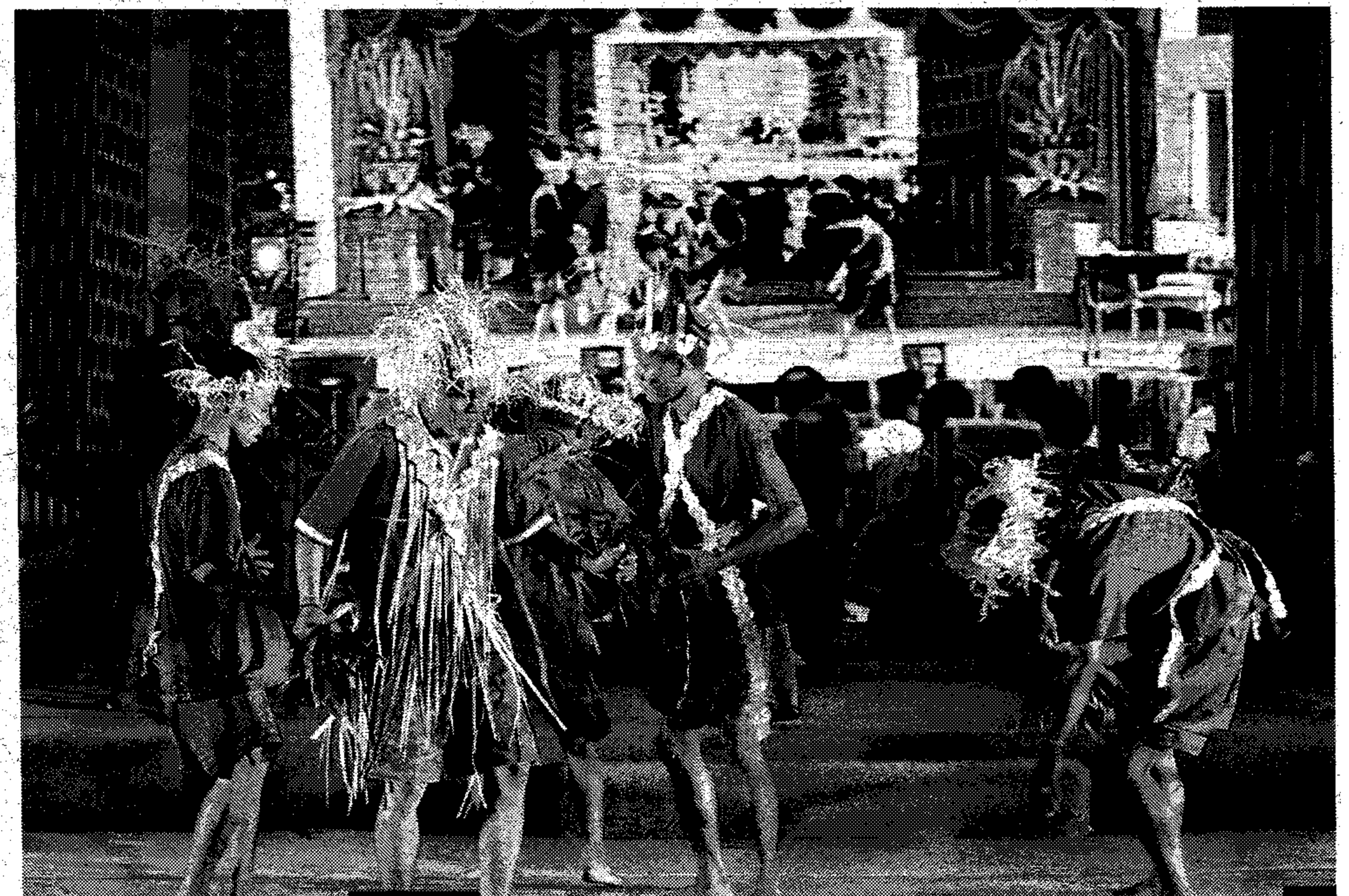
تارین سیوغ یغ داعتراف واریئن کبودیائےن تیدق کتارا دفرسمبھکن قد مجلس فغیشتهارن 50 واریئن کبغسائےن دباغونن فرلیمن، بارو۲ این.

قمیلیهن باغونن این برداسرکن کفنتیغش کفد سجاره نگارا سلائےن سنی بینا دان قرانن سسواتو خزانہ ایت قد زمانش.