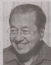
Che D.E.T. Menulis

ayun yang boleh dibuka dan tutup untuk benarkan kapal atau keretapi lalu. Untuk memendekkan cerita, kerja pembinaan jambatan bengkok dihentikan untuk membolehkan kerajaan Dato' Seri Abdullah menjual 1 billion meter padu pasir dan hak laluan terbang pesawat tentera Singapura