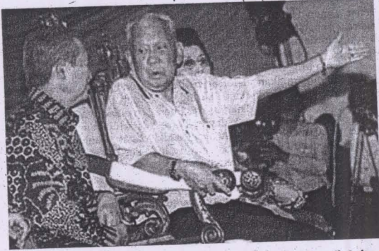
DYMM Tuanku Sultan Iskandar ibni Almarhum Sultan Ismail, Sultan Johor, telah berkenan untuk mencemar duli dan merasmikan SJER yang dinamakan semula sebagai Wilayah Pembangunan Iskandar (WPI) dalam satu upacara khas di Danga Bay, Johor Bahru pada 4 November 2006.

5. Sebabnya ialah kerana Malaysia, mengikut istilah pasar, "tak makan cekak" iaitu tidak