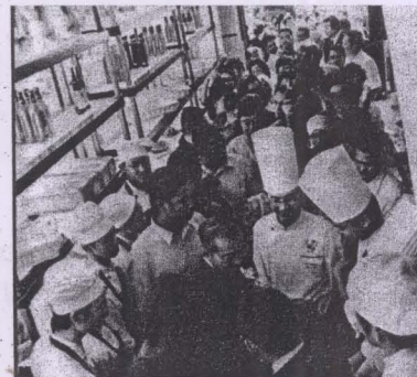
Perasmian 'The Loaf' oleh Tun Dr Mahathir menarik begitu ramai peminat roti dan peminat Dr Mahathir sendiri seperti yang dilihat dalam gambar.