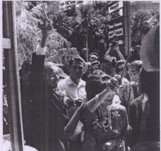
Tun Dr Mahathir dibantu oleh Tun Dr Hasmah kelihatan menepong tawar kedai roti 'The Loaf' sebelum memasuki kedai tersebut.