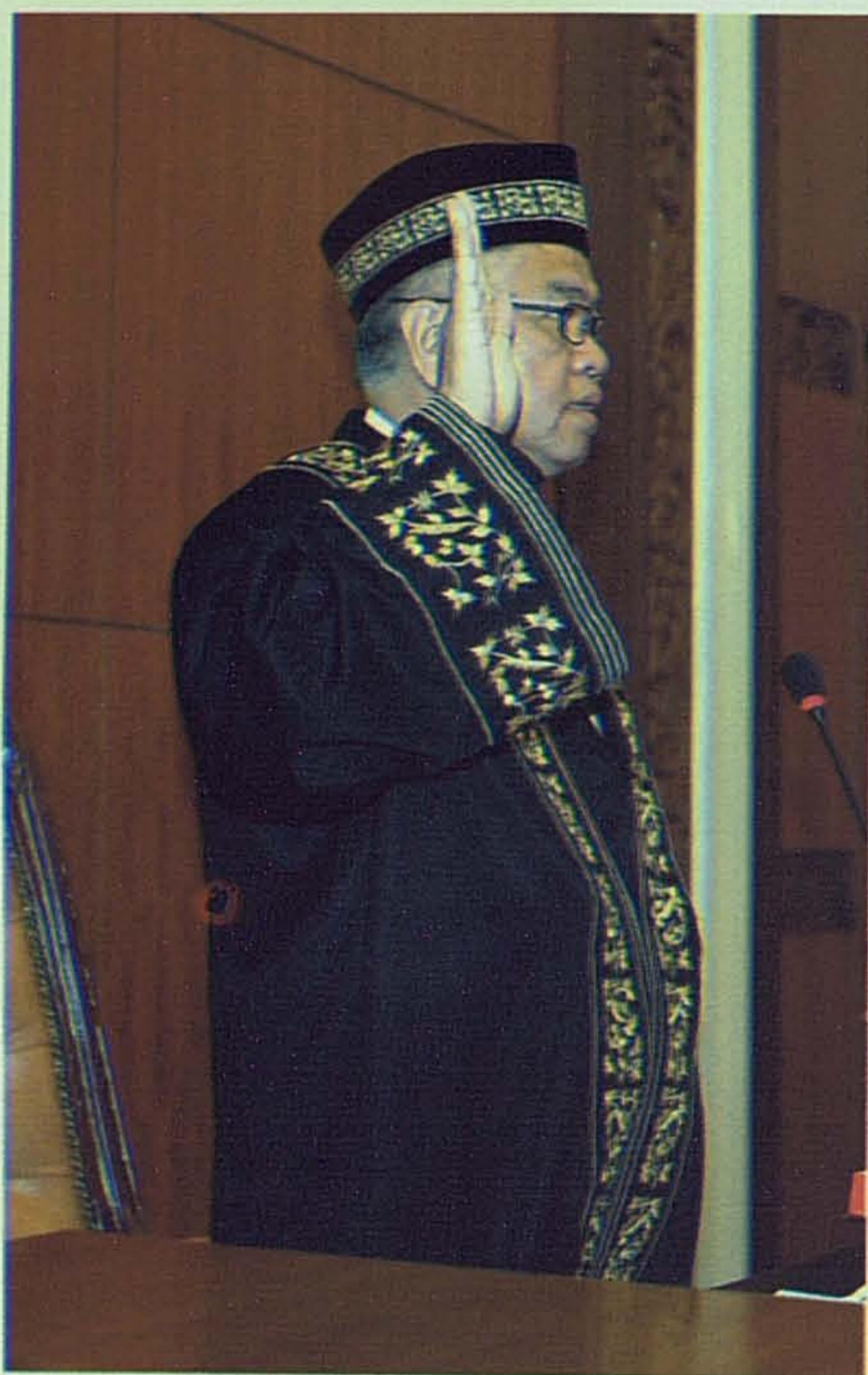
Yang di-Pertua Dewan Negara yang ke-15