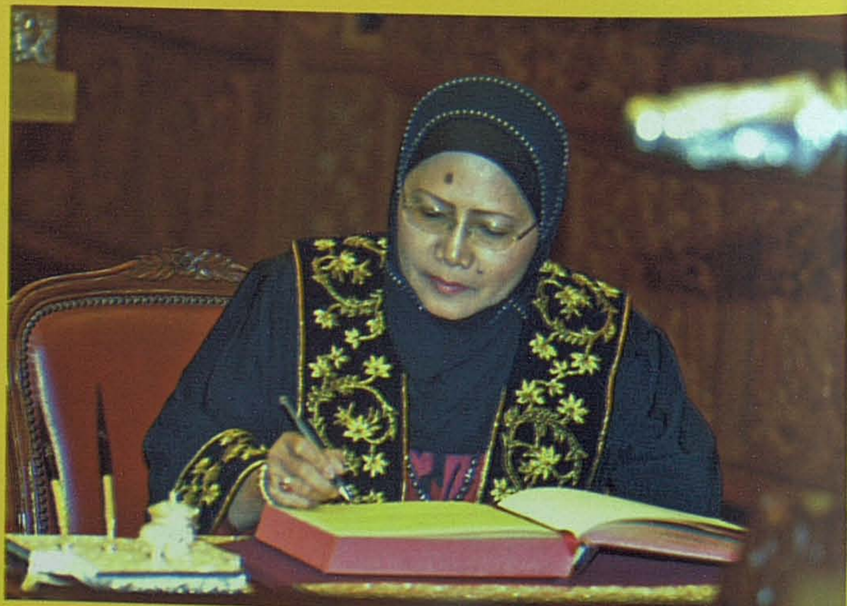
Y.B. Senator Datuk Armani Mahiruddin menandatangani watakah pelantikan.

Sebagai Ketua Pergerakan Wanita Umno Sabah, perjuangan dalam politik telah banyak membantu meningkatkan jati diri dan pemahaman beliau terhadap kehendak masyarakat khususnya di peringkat akar umbi. Tidak relevan lagi andai kita menganggap wanita di negara ini dipinggirkan, sebaliknya suara wanita semakin didengari dan buktinya amat nyata, apabila kerusi Timbalan Yang di-Pertua Dewan Negara diduduki oleh seorang wanita.