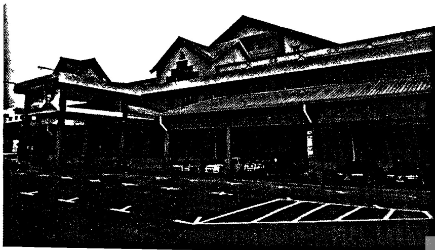
GEDUNG ILMU: Perbadanan Perpustakaan Awam Melaka (PERPUSTAM)

Nama kutubkhanah asalnya dikenali dalam bahasa Urdu yang bermaksud perpustakaan atau sebuah ruang yang menempatkan koleksi buku untuk membaca, membuat rujukan dan pinjaman kepada masyarakat. Pustaka pula ditafsirkan sebagai satu lambang puncak keilmuan untuk masyarakat dan negara bagi mengkaji dan meneroka sumber maklumat dan ilmu dalam pelbagai bidang perkara.