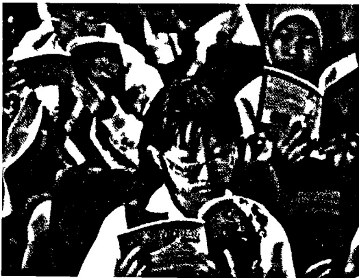
BACA: Program galakan membaca untuk pelajar sekolah di PNM.

Dasar ini juga menyokong Dasar Buku Negara perkara 3 iaitu ‘memastikan rakyat Malaysia mempunyai minat membaca yang tinggi dan menggunakan bahan bacaan yang berkualiti’.