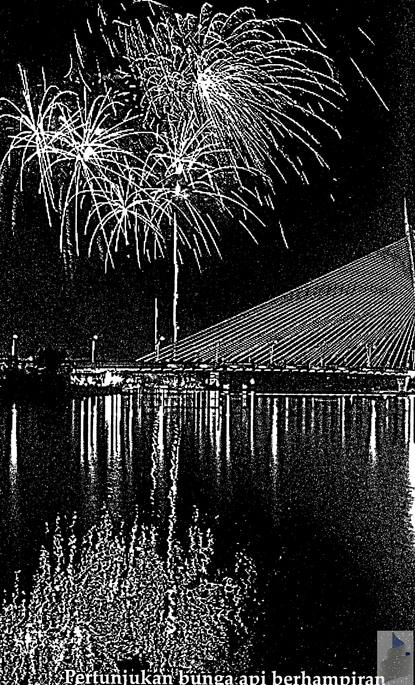
Pertunjukan bunga api berhampiran Jambatan Seri Wawasan, Putrajaya.