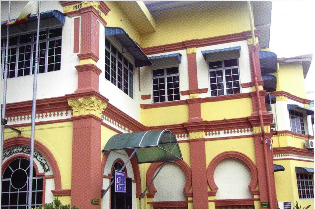
Jabatan Agama Islam Selangor (gambar di atas). Haji Azhari pernah berkhidmat sebagai pengapit mahkamah dan kadhi di sini