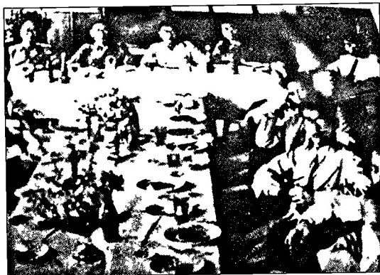
Kesatuan Melayu Muda (KMM)

Pertubuhan Kebangsaan Melayu Bersatu United Malay National Organisation UMNO / PEKEMBAR آرتو يو هن كيمسان ملايو برساتو