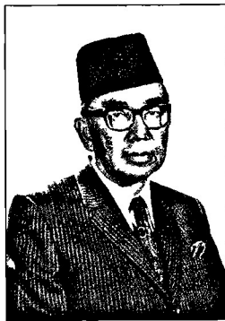
Abdul Razak Hussein