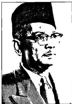
Tunku Abdul Rahman