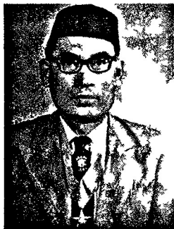
Dr Burhanuddin Helmy