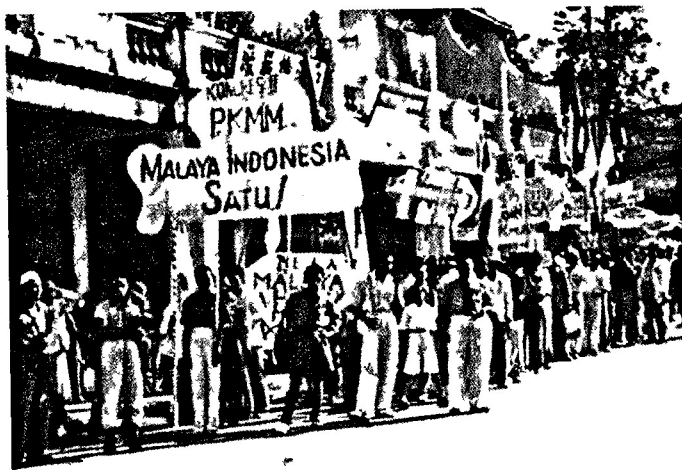
Parti Kebangsaan Melayu Malaya (PKMM)

hanya berani melaungkan “Hidup Melayu!”. Parti-parti dan pemimpin-pemimpin yang mula menggerakkan perjuangan kemerdekaan tulen selalunya disebutkan sedikit saja dalam buku-buku teks sejarah rasmi itu.