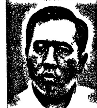
Anthony Loke Siew Fook (DAP - Seremban)