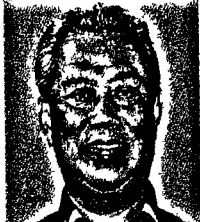
Tan Sri Muhyiddin Yassin (PPBM - Pagoh)