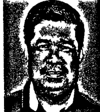
Mohamad Sabu (Amanah - Kota Raja)