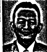
Dr Mazlee Malik (PPBM - S. Renggam)