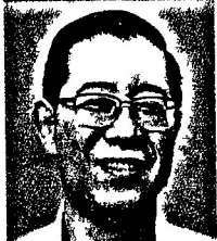
Lim Guan Eng (DAP - Bagan)