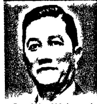
Datuk Seri Mohamed Azmin Ali (PKR - Gombak)