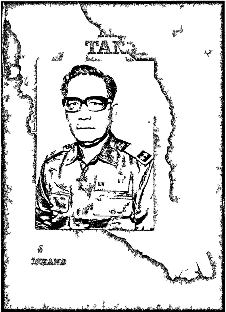
Gambar 2: Muka judul buku Melihat Tanah Air , terbitan Percetakan Timur (1975)