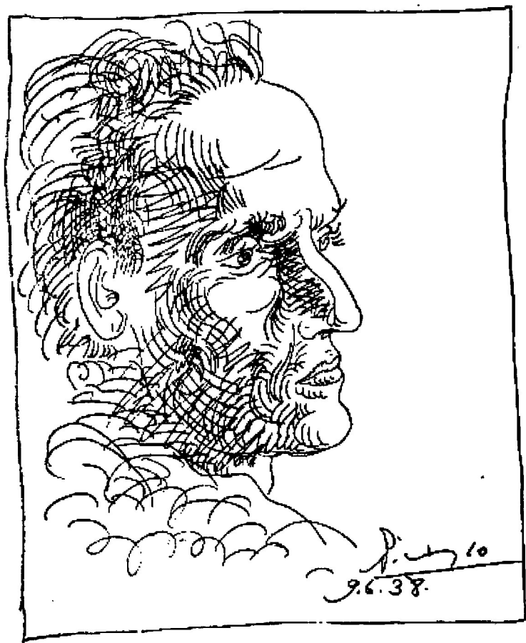
PICASSO: César Vallejo (I). Dibujo sobre stencil.