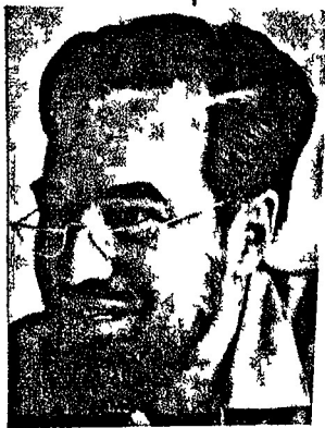
PROF. UNGKU AZIZ

CHERAMAH PROF. UNGKU AZIZ DALAM FORAM TALIVISHEN