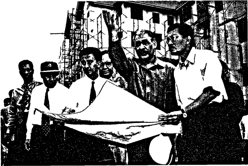
DS Anwar Ibrahim tokoh yang banyak mempopularkan gagasan Masyarakat Madani bermula dalam ucapan di festival Istiqlal Jakarta 1995

Ibrahim cuba menyuntik kesedaran di kalangan semua pihak untuk menghidupkan semula kekuatan leluhur negara-bangsa dengan nilai murni dan jati diri yang harus dikembalikan semula ke persada nusa – menjadi amalan kita semua.