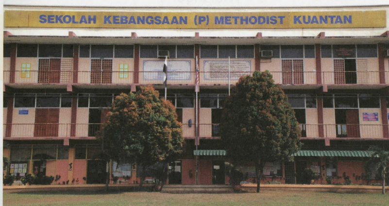
Sekolah Kebangsaan (P) Methodist Kuantan salah sebuah sekolah berprestasi tinggi

KEMENTERIAN PENDIDIKAN MALAYSIA (KPM) telah mendefinisikan Sekolah Berprestasi Tinggi atau SBT ditakrifkan sebagai sekolah yang mempunyai etos, watak, identiti tersendiri dan unik serta menyerlah dalam semua aspek pendidikan. Sekolah SBT ini mempunyai tradisi budaya kerja yang sangat tinggi dan cemerlang dengan modal insan nasional yang berkembang secara holistik dan berterusan serta mampu berdaya saing di persada antarabangsa. Justeru, SBT menjadi sekolah pilihan utama pilihan ibu bapa dan pelajar yang ingin kan kecemerlangan.