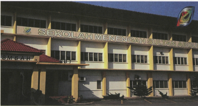
Sekolah Menengah Sultan Abdul Halim, Jitra, antara sebuah sekolah berasrama penuh premier di Malaysia

S EJARAH penubuhan Sekolah Berasrama Penuh (SBP) bermula pada tahun 1890, ketika R.O. Winsted menjadi Timbalan dan kemudiannya menjadi Pengarah Pelajaran Tanah Melayu. Pada tahun 1980, 'The Selangor Raja School' telah ditubuhkan sebagai memulakan langkah melahirkan elit Melayu daripada kalangan istana dan anak-anak pembesar negeri, menerusi pendidikan aliran Inggeris.