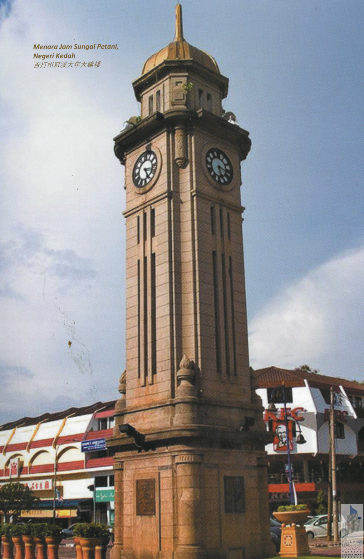
Menara Jam Sungai Petani, Negeri Kedah 吉打州双溪大年大鐘樓