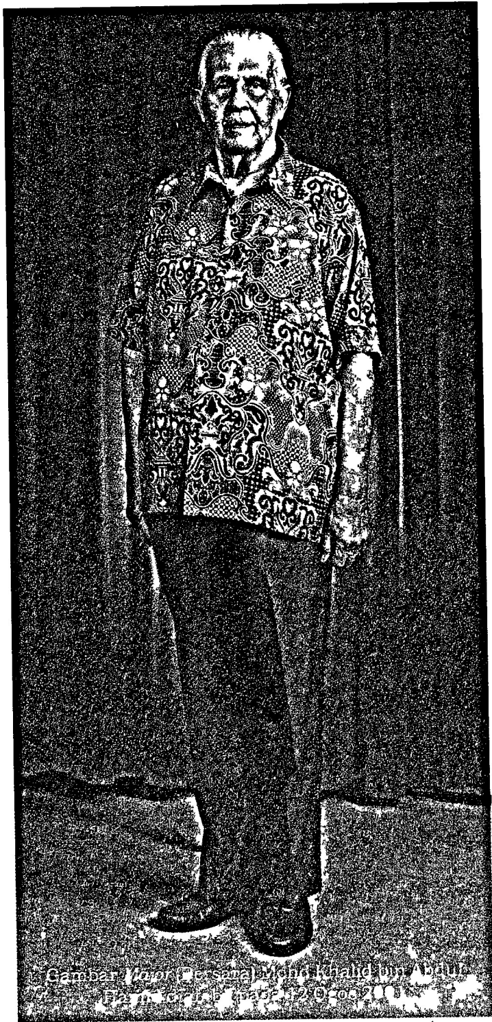
Gambar Mayor (Pensama) M. Said (Khalid bin Walid) Panglima TNI, tanggal 22 Agustus 2002