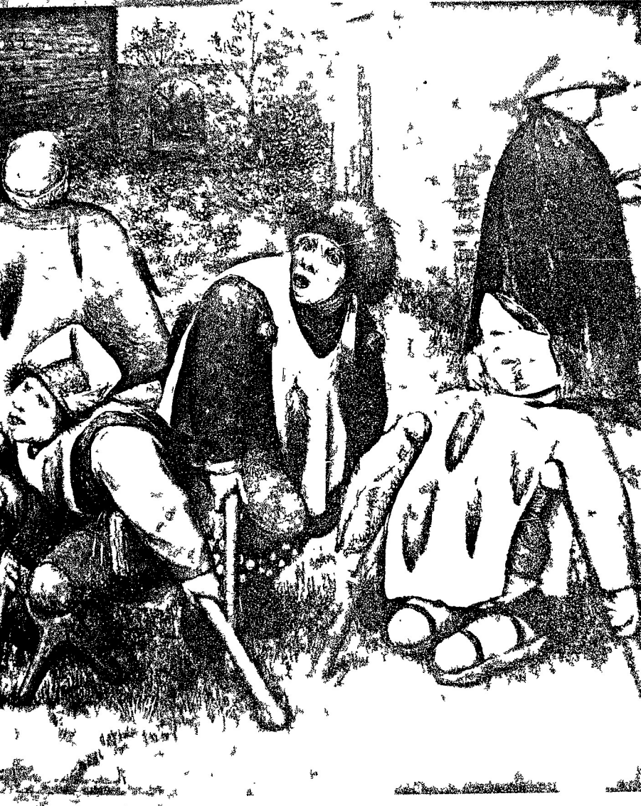
The Beggars, 1568 Pieter Bruegel the Elder