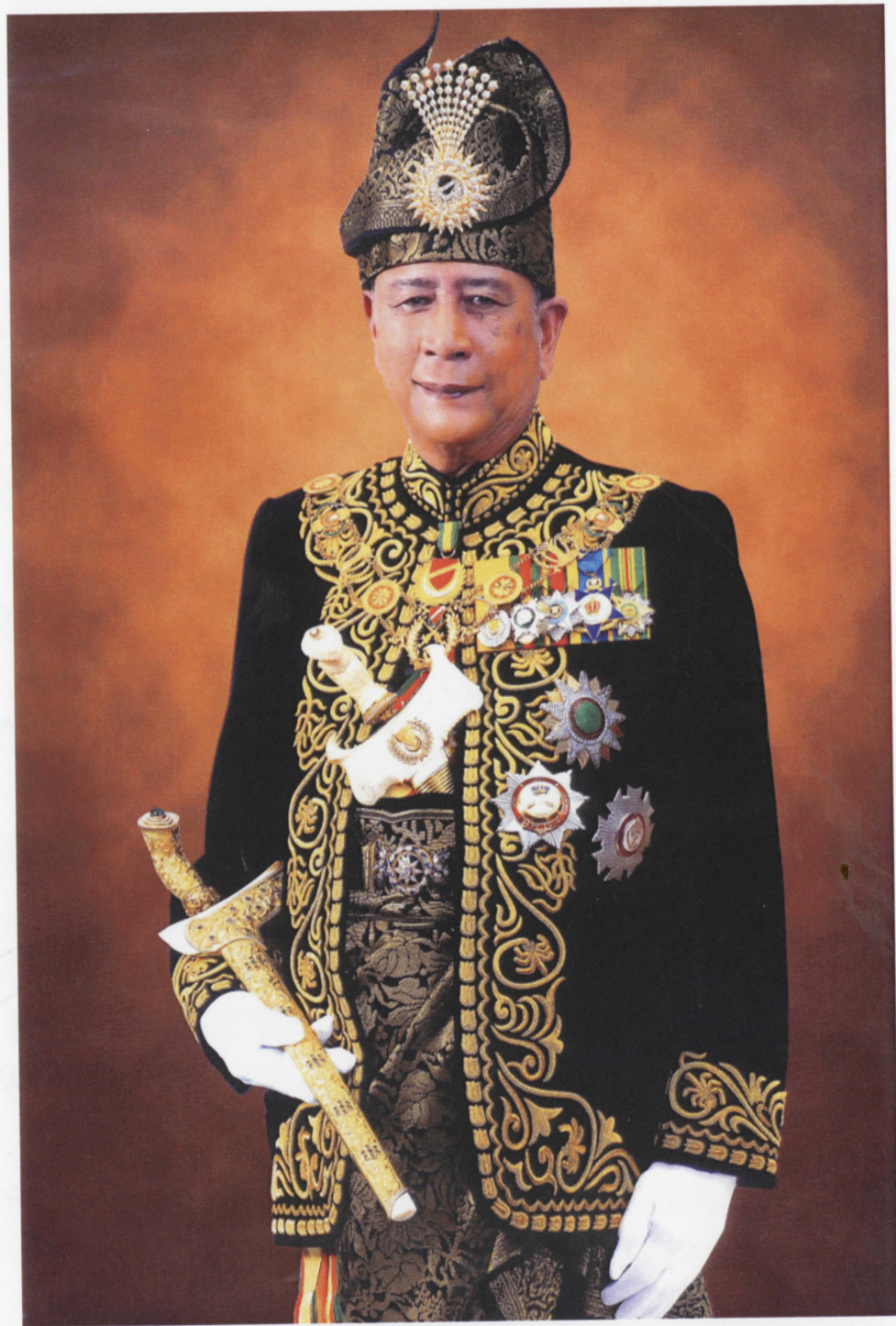
Kebawah Duli Yang Maha Mulia Al-Aminul Karim Sultan Sallehuddin ibni Almarhum Sultan Badlishah D.K., D.K.H., D.U.K., D.K. (Kelantan), D.K. (Johor), D.K. (Perak), D.K. (Selangor), D.M.K., S.M.D.K., S.H.M.S., S.G.M.K., S.P.M.K., S.S.D.K. Sultan Negeri Kedah Darul Aman