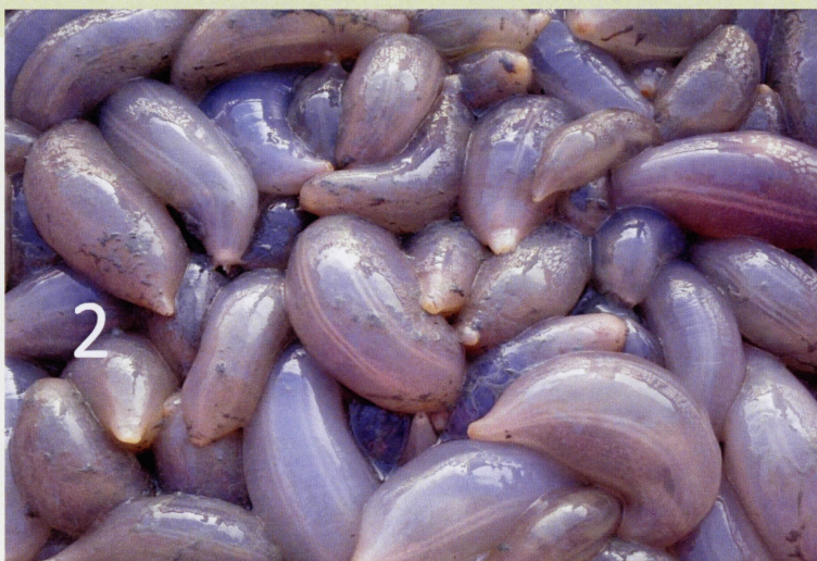
Gambar: Beronok, sejenis timun laut, dijadikan juadah eksotik oleh masyarakat Langkawi

Sebelum tahun 1960-an hutan-hutan di Langkawi merupakan sumber makanan eksotik penduduk Langkawi, seperti pelanduk, burung-burung, siput-siput di hutan bakau serta di batu-batu laut. Di muara sungai yang airnya payau tetapi jernih terdapat sejenis lumut laktut yang boleh dimakan sebagai ulam, manakala di dalam lumpur laut terdapat sejenis timun laut disebut beronok. Gamat dan teripang adalah hasil laut yang dijadikan ubat-ubatan, ditambah dengan sarang burung layang-layang daripada gua-gua batu kapur, menambah keunikan Langkawi.