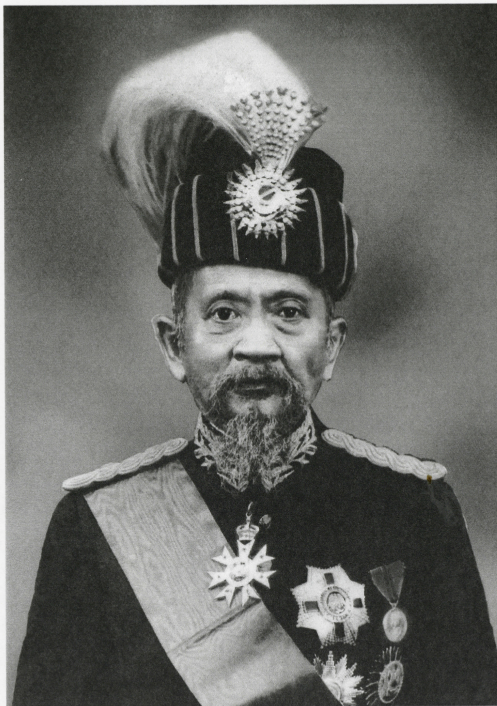
Almarhum Sultan Abdul Hamid Halim Shah ibni Sultan Ahmad Tajuddin Mukarram Shah, Sultan Kedah ke-26 (1881-1943).

Dalam zaman pemerintahan baginda, pentadbiran daerah Langkawi diswastakan, disebut 'Pajak Langkawi'.