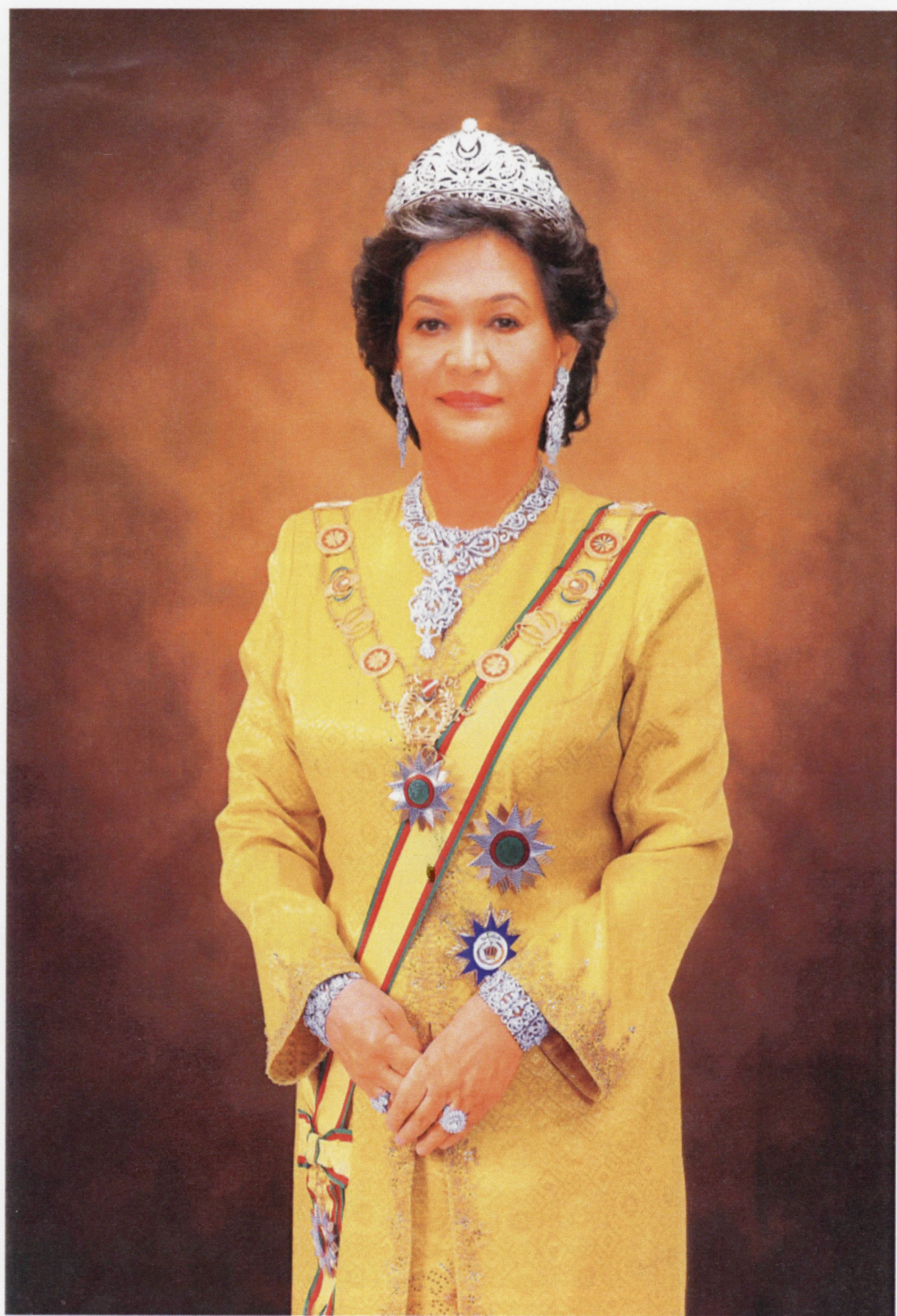
Kebawah Duli Yang Maha Mulia Sultanah Maliha Binti Tengku Ariff, S.H.M.S., S.S.D.K., D.S.D.K. Sultanah Negeri Kedah Darul Aman.