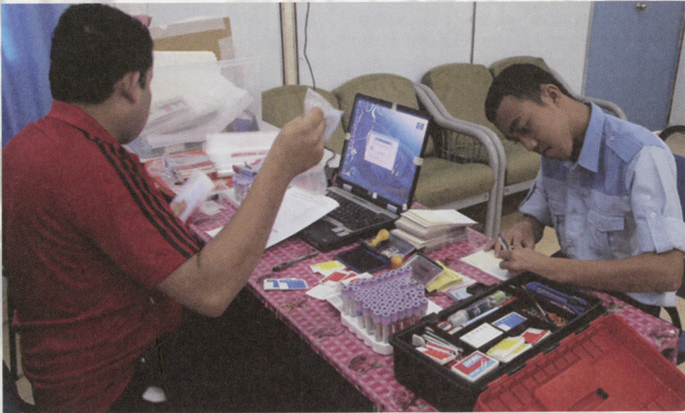
Ujian darah dilakukan untuk mengenal pasti jenis darah sebelum dibenarkan untuk menderma darah

Majlis PLKN bertanggungjawab untuk menasihati Menteri dalam semua perkara berhubung PLKN.