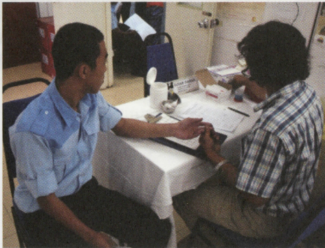
Pelatih sedang melalui pemeriksaan kesihatan untuk pastikan pelatih layak untuk menderma darah

Mungkin, keluarga yang membuat mereka terpesong atau mungkin juga cara hidup masyarakat lain yang lebih menarik mempengaruhi mereka ke alam yang penuh dengan pancaroba hidup. Walau apa pun yang berlaku, setiap negara menghadapi masalah yang sama iaitu mengenal pasti keperluan remaja dan mengawal nafsu mereka dengan membuka peluang-peluang lain yang sama menarik dan menguntungkan seperti aktiviti sukan rakyat dengan hadiah-hadiah menarik, mencari bakat dengan peluang-peluang pekerjaan yang terbuka, bersenam untuk kesihatan, mencari ilmu lain yang lebih bermakna untuk berjaya dalam hidup yang penuh dengan cabaran moden.