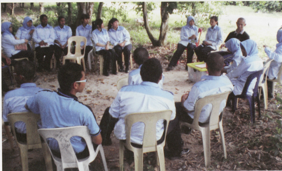
Para peserta sedang menjalani suasana pembelajaran di luar kelas

Asas perbincangan adalah atas masalah remaja yang mewakili golongan rakyat yang terbesar di negara kita. Mereka senang dipengaruhi dan perlu dibelai dengan kasih sayang serta diberi perlindungan dan pimpinan hidup yang sebaik-baiknya oleh ibu bapa atau keluarga. Kadang kala, belaian kasih sayang tidak diberi maka mengakibatkan mereka terjerumus ke dalam pelbagai gejala jenayah atau maksiat.