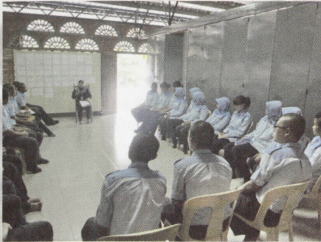
Para peserta tekun mendengar sewaktu sesi kendalian jurulatih