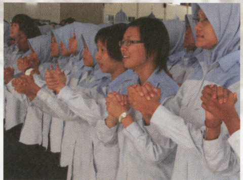
Memupuk semangat setiakawan di antara peserta PLKN