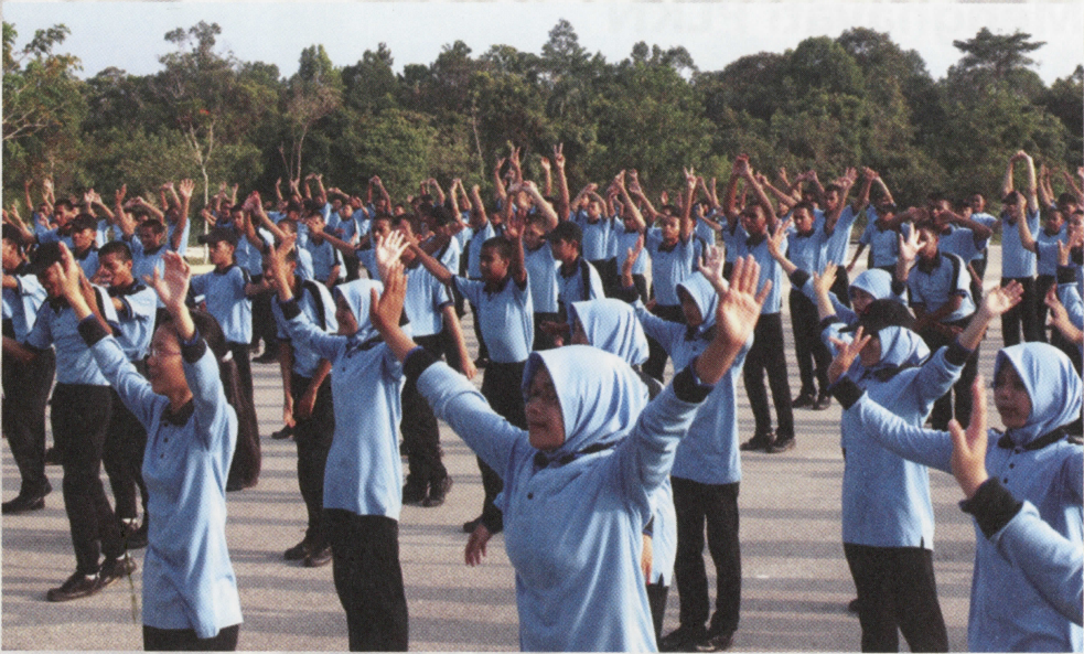
Kecergasan fizikal amat diperlukan bagi menempuh hari-hari seterusnya