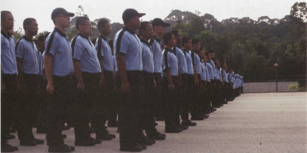
Inilah bakal-bakal pemimpin kita pada masa hadapan