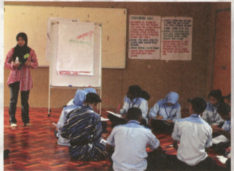
Para peserta sedang menjalani latihan berkumpulan