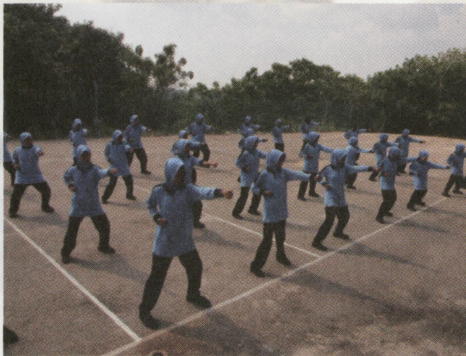
Elemen seni mempertahankan diri sedang dilakukan dalam aktiviti di kem