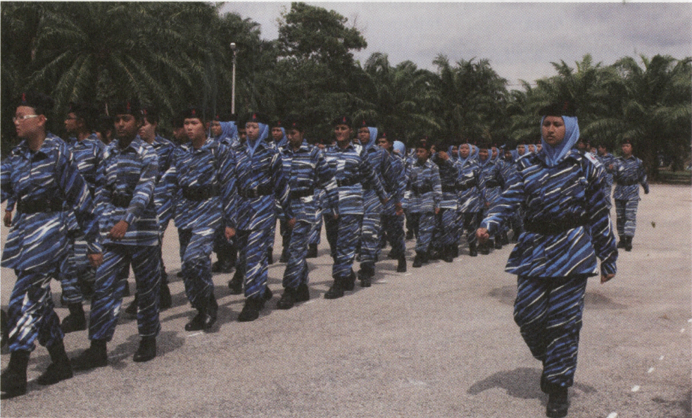
Pembentukan disiplin melalui aktiviti berkawad dapat memupuk kesedaran tentang betapa pentingnya semangat bekerja secara berkumpulan