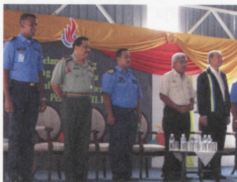
Majlis pentauliahan para jurulatih dijalankan secara formal

Menteri boleh melantik jurulatih daripada kalangan pegawai awam kerajaan atau badan-badan berkanun atau mana-mana individu untuk menjadi jurulatih dan menentukan syarat dan jangka masa tugas mereka.