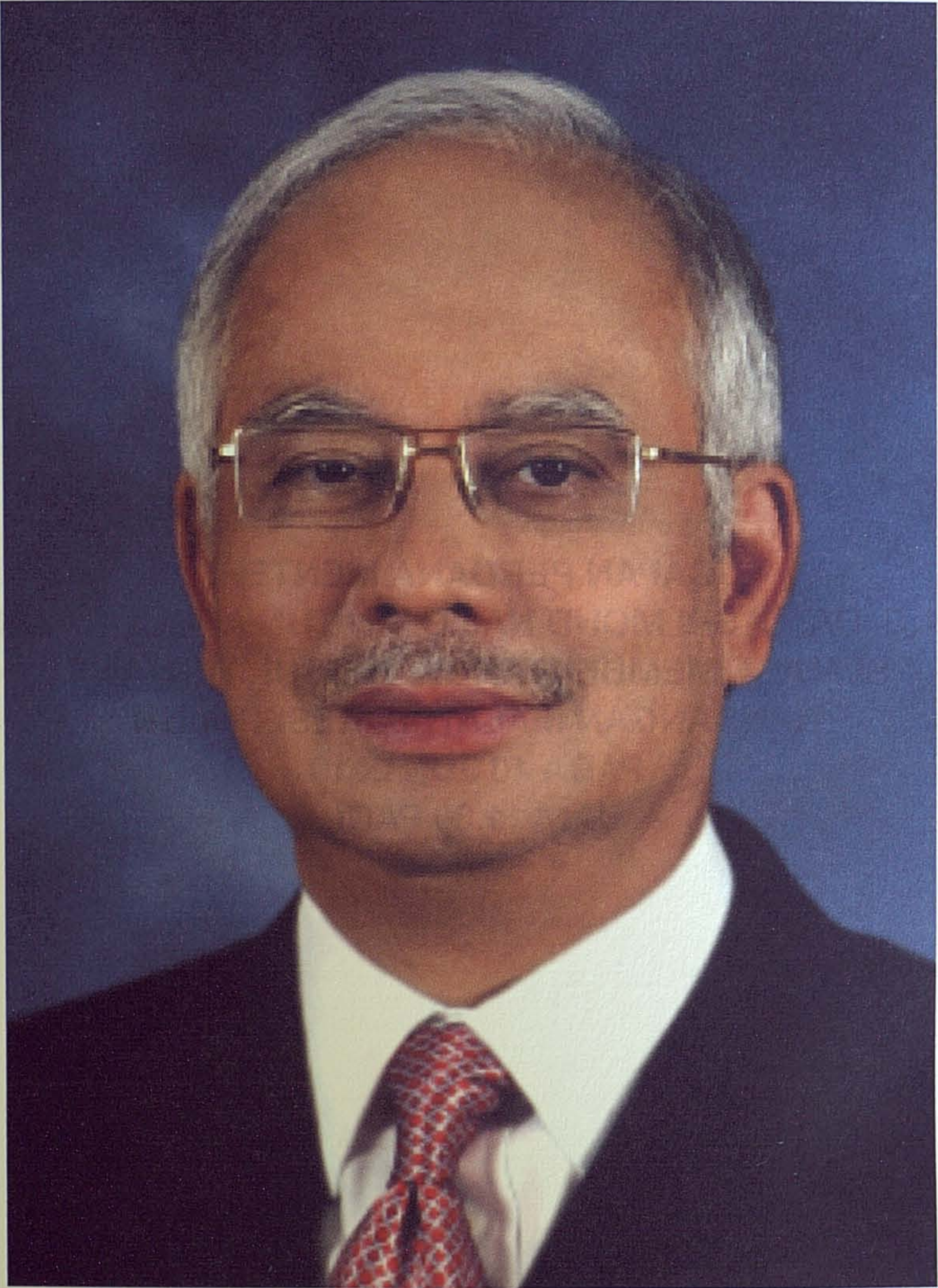
Y.A.B. DATO' SRI MOHD NAJIB BIN TUN ABDUL RAZAK PERDANA MENTERI MALAYSIA