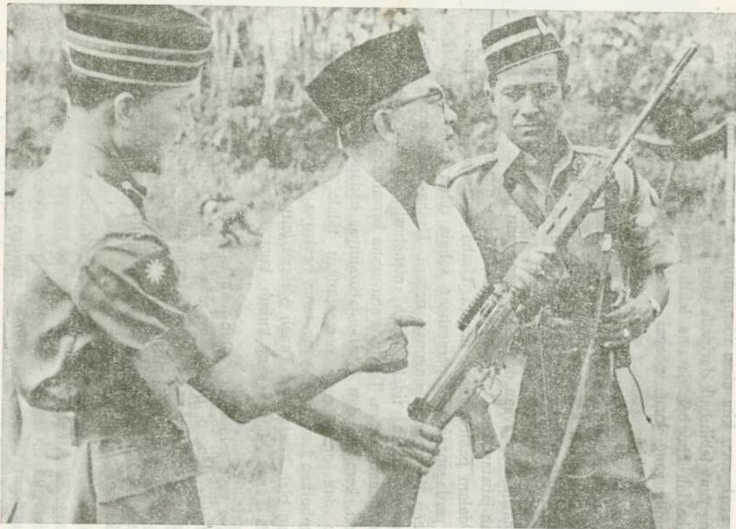
Tun Abdul Razak bin Hussein sedang memegang sepucuk senapang semasa lawatannya di Kem Brigade Pertama Regimen Melayu Diraja, Sungai Besi, Kuala Lumpur pada 12hb Jun, 1962.