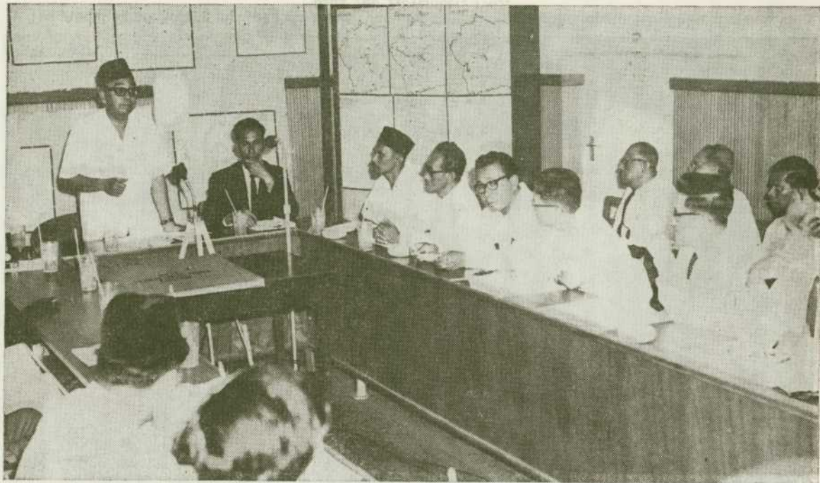
Tun Abdul Razak berucap di hadapan Pegawai-pegawai Kerajaan dan Ahli-ahli Dewan Negeri di Bilik Gerakan Pembangunan Rancangan Luar Bandar, Kuala Lumpur pada 20hb Oktober, 1963.