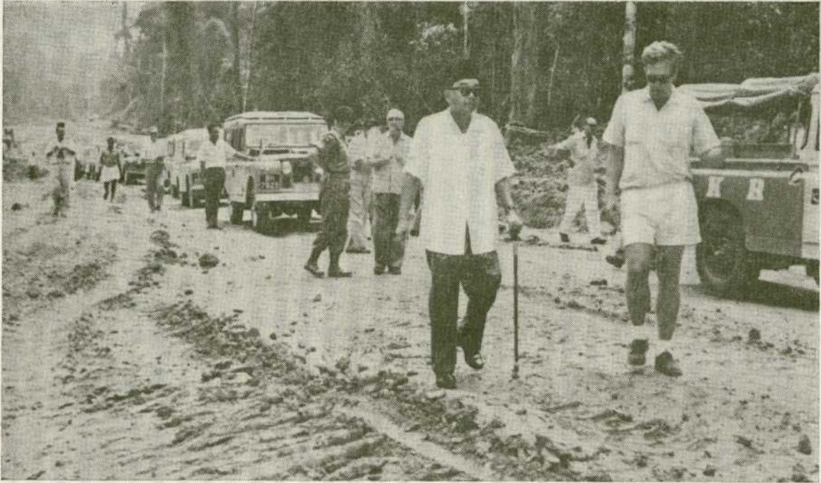
Tun Abdul Razak, bersongkok dan memegang tongkat, menyaksikan projek membuat jalan baru dari Kuala Kurau ke Jalan Jerantut pada 8hb November, 1963.