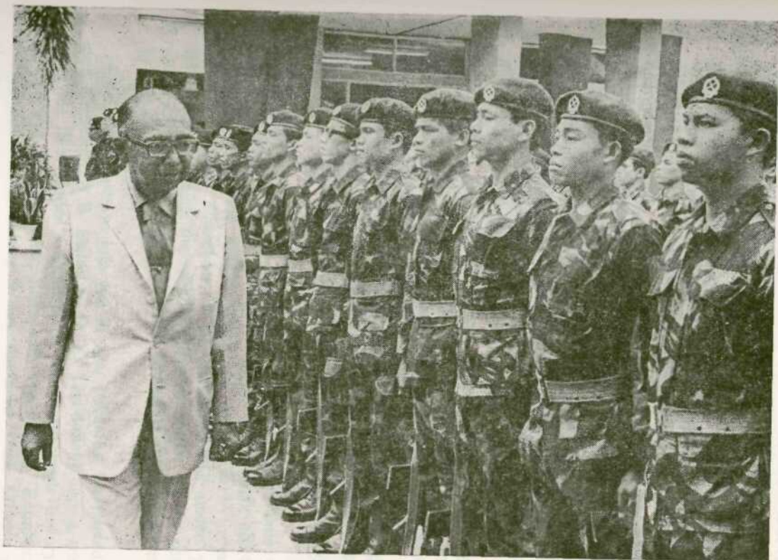
Tun Abdul Razak bin Hussein kelihatan sedang memeriksa barisan penghormatan oleh enam puluh orang Askar Wataniah pelajar-pelajar dan kakitangan Institut Teknologi MARA di Petaling Jaya pada 10hb Januari, 1972.