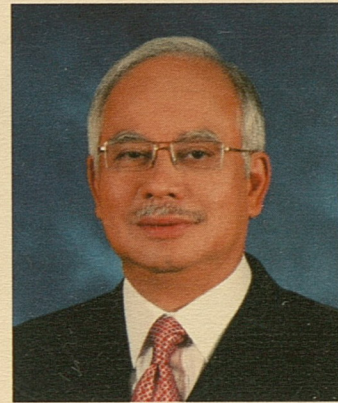
Perdana Menteri Malaysia