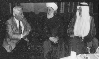
FORUM WAQAF KUWAIT, 22.2.2009 (Bersama Mufti Besar Lebanon serta Ketua Setiausaha, Penguasa Waqaf Kuwait)

Darjat Khalifah bagi Melayu-Muslim sangat penting, bukan sahaja untuk mereka, bahkan untuk kepentingan besar jangka panjang pembentukan bangsa Malaysia dan kesejahteraan negara amnya. Kerana, satu bangsa Malaysia yang berdikari dengan penuh keyakinan diri tidak akan lahir selagi penduduk majoritinya, iaitu Melayu-Muslim, lemah, dependent , dijajah minda dan bergolak jiwanya, justeru tidak berjati diri, bebas dan merdeka dalam erti kata sebenarnya.