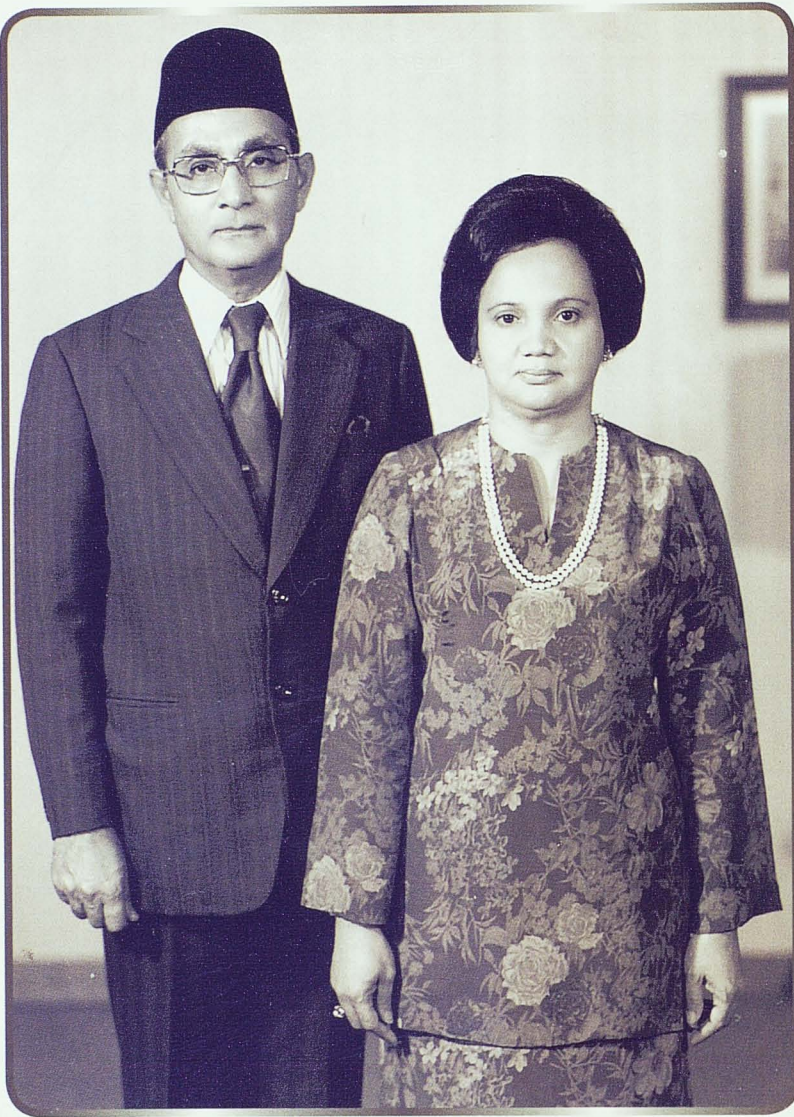
◀ Kenangan Tun Hussein Onn bersama isteri Toh Puan Suhaila Tan Sri Mohd Noah.

menamatkan pengajiannya apabila Perang Dunia Kedua meletus. Beliau telah menyertai Pasukan Tentera Johor (Johor Military Forces) dan menjalani latihannya di Maktab Tentera Sandhurst di Dehra Dun, India pada awal tahun 1941, dan menerima tauliah pada tahun 1942. Selepas itu beliau menyertai Regiment Hyderabad Ke-19 di India.