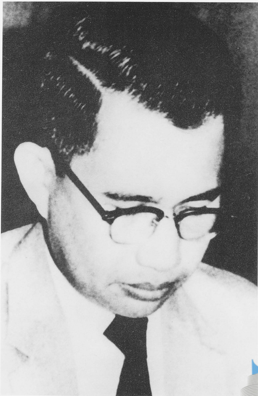
Aminuddin bin Baki (26 Januari 1926-24 Disember 1965)