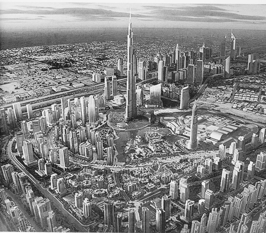
Gambar ilustrasi, Dubai, UAE