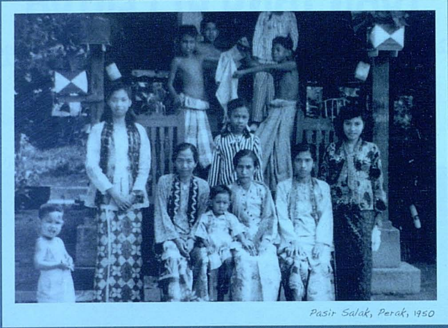
Pasir Salak, Perak, 1950