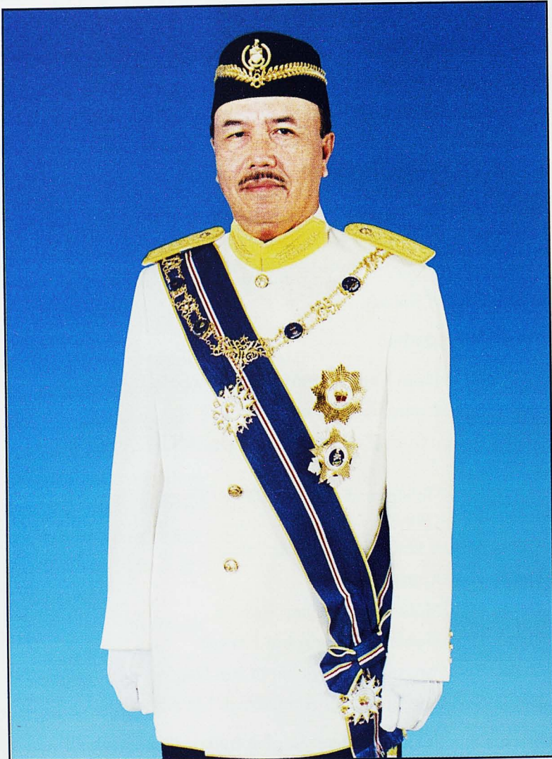
TUAN YANG TERUTAMA TUN DATUK SERI PANGLIMA HAJI AHMADSHAH BIN ABDULLAH S.M.N., S.P.D.K., D.P., P.G.D.K., A.S.D.K., K.M.N., J.P. YANG DI-PERTUA NEGERI SABAH