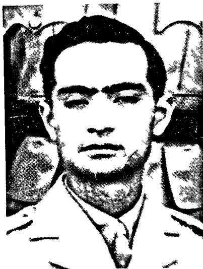
Wajah di alam tentera.

Tengku Razaleigh, Datuk Musa Hitam, Encik Ghafar Baba, Datuk Senu Abdul Rahman, Datuk Harun Idris dan beberapa orang lagi, maka Datuk Hussein dikira yang paling akhir sekali masuk UMNO. Tetapi nampaknya beliau juga yang lebih awal meninggalkan kegiatan UMNO yang aktif.